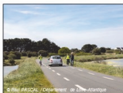
Chaussée à voie centrale banalisée (ou chaussidou)